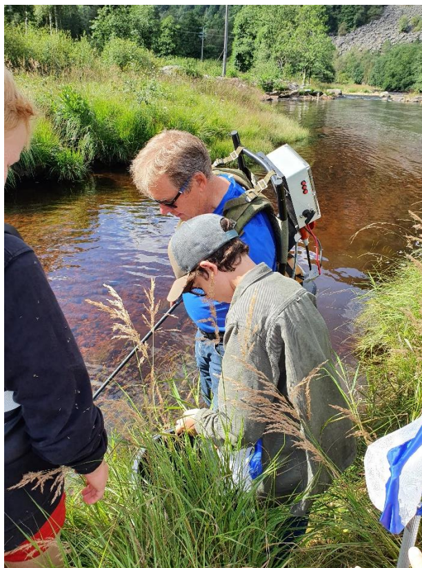
Figur 2 Lakseforskarar for ein dag i aksjon

med på barneaktivitetar i løpet av året. Det har vore nokre gruppebesøk gjennom året. Mellom anna var Miljødirektoratet på besøk i september, med ei gruppe med Statens oppsynsmenn frå heile landet.