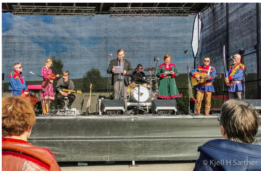
Figur 7 Opningsseremoni Tana - helsing frå fylkesordføraren i Troms og Finnmark

Me fekk økonomisk støtte til opninga frå Tana kommune.