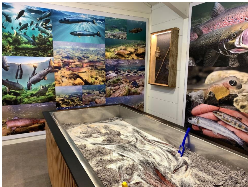
Figur 6 Mellombelse utstillingar - bord for å vise korleis ei elv vert til, endrar seg og vert forma av vatnet.

Me fekk økonomisk støtte til utstillingane frå Tana kommune og Sametinget.