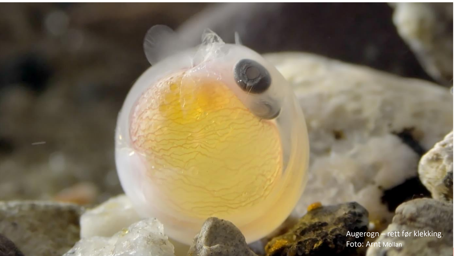
Augerogn – rett før klekking.

Nasjonaale Loesejarnge • Nasionála Luossaguovddáš