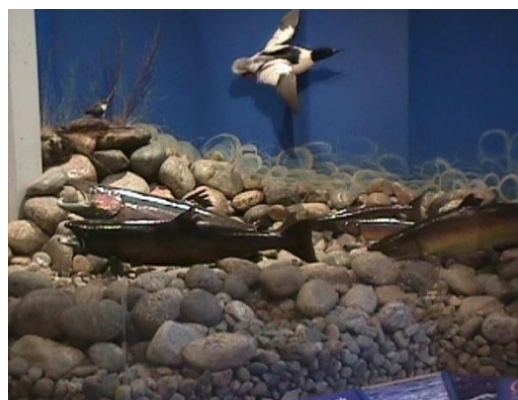
Figur 3 Villakssenteret i Lærdal – gamle utstillingar.

Nasjonalt villakssenter vil ha anlegget som utgangspunkt for sine aktivitetar i Vest-Noreg.