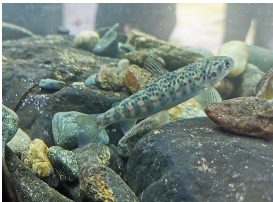
Figur 5 Den sjeldne Namsblanken slik du kan sjå han i akvarium på Namsskogan familiepark.

Gjennom året har NVS Namsos hatt opplegg for 11 grunnskular, to barnehagar, ein folkehøgskule og lina for sportsfiske på Grong VGS. Me har gjort fagleg bidrag på Camp villaks og hatt stand på kulturmarknaen i Namsos. På Namsskogan familiepark – med 50 000 besøkande i 2021 – er det formidla kunnskap om Namsblank og elvemusling. Det vert vist fram levande namsblank, aure og elvemusling.